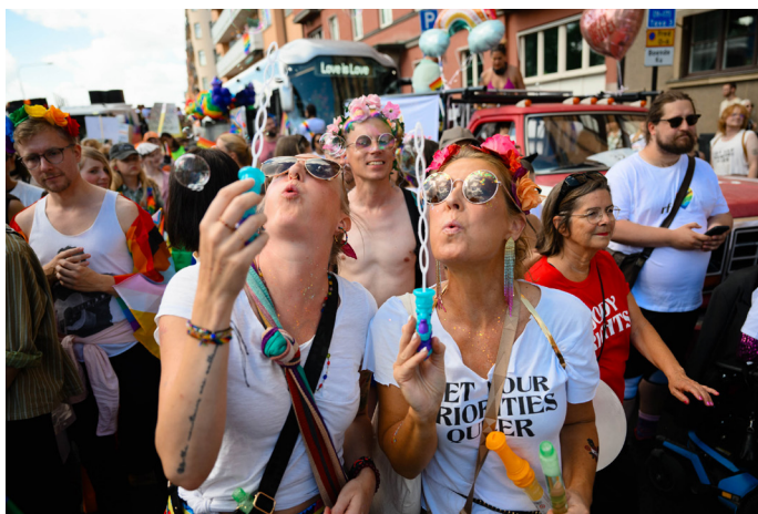
Festlig stämning i Prideparaden 2023.

Att arbeta för att stärka kommunikationen med medlemmarna har även 2023 varit ett fokusområde. RFSU Stockholm har terminsvis upprättat en kommunikationsplan och utvärderat vilka digitala plattformar föreningen kommunicerar via, till exempel har slutsatsen dragits att en äldre målgrupp nås via nyhetsbrev och Facebook, medan en yngre målgrupp nås av Instagram och TikTok. Det här är något som föreningen behöver fortsätta att se över och ta nya tag kring för att nå olika och nya målgrupper i samhället.