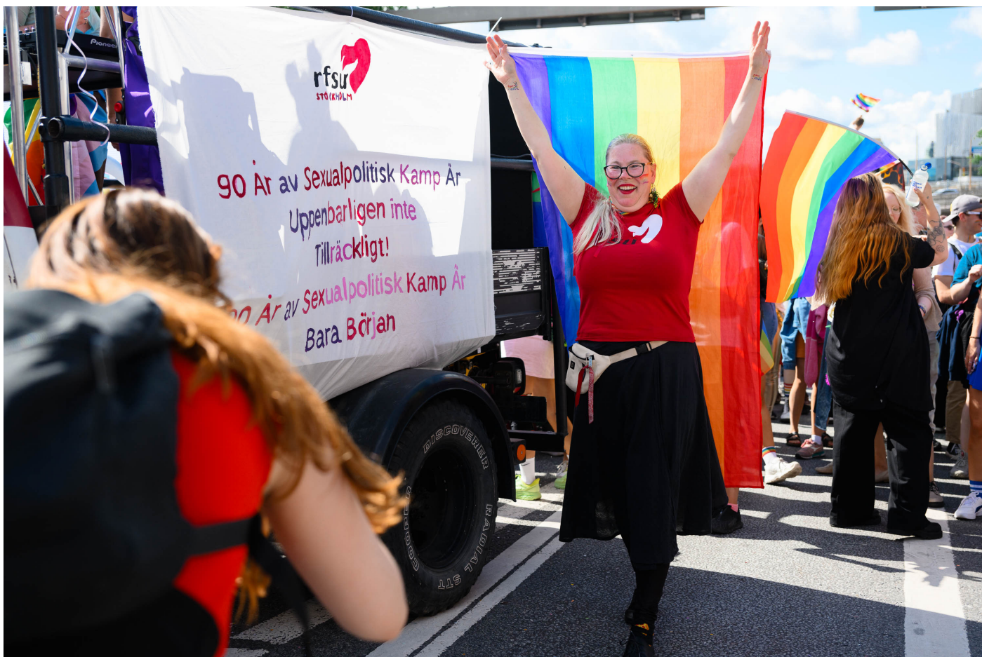
RFSU Stockholms ekipage i Prideparaden 2023.