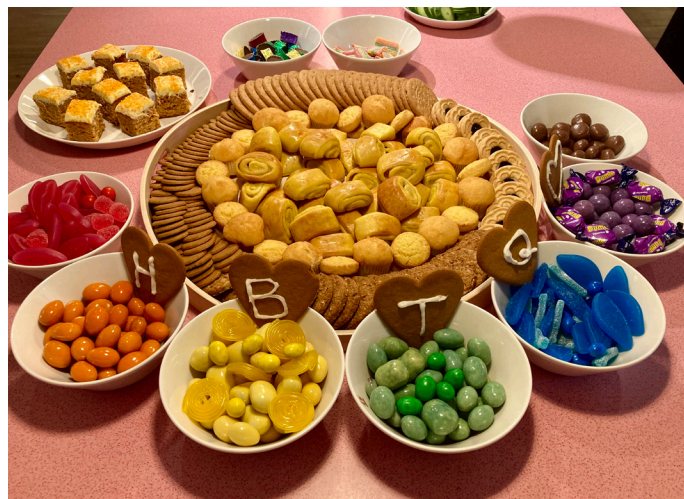
HBTQ-tema även på fikar under en cafékväll.

Under 2023 beviljades ytterligare ett nytt projekt för att stärka SRHR för personer med intellektuell funktionsnedsättning och/eller autism - denna gång helt riktad till vuxna, med medel från socialnämnden i Stockholms stad. Projektåret sträcker sig juli till och med juni så är i skrivande stund halvvägs och har hunnit genomföra två mycket uppskattade cafékvällar, den ena med tema mens och den andra med tema HBTQ, den sista i samverkan med RFSL Stockholms verksamhet HBTQ-hänget.