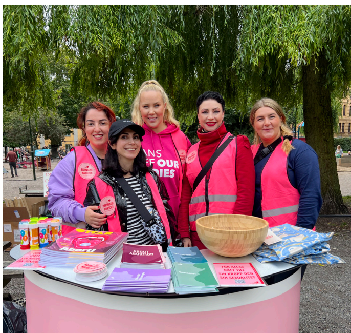
Delar av arbetsgruppen för Barnvagnsmarschen 2023.

I september 2023 anordnade RFSU Stockholm Barnvagnsmarschen i södra Stockholm för att uppmärksamma mödradödligheten i världen. RFSU:s kampanj Barnvagnsmarschen har sedan 2010 genomfört 640 marscher över hela Sverige för att sprida kunskap om mödradödlighet och omkring 32 000 deltagare har marscherat genom olika städer för att engagera sig. Detta år fick dock evenemangen genomföras i mindre skala och på färre platser i landet samt planeras av lokalföreningarna själva. Detta till följd av regeringens nya inriktning på biståndet från Sida som tidigare finansierat kampanjen i RFSU-förbundets regi.