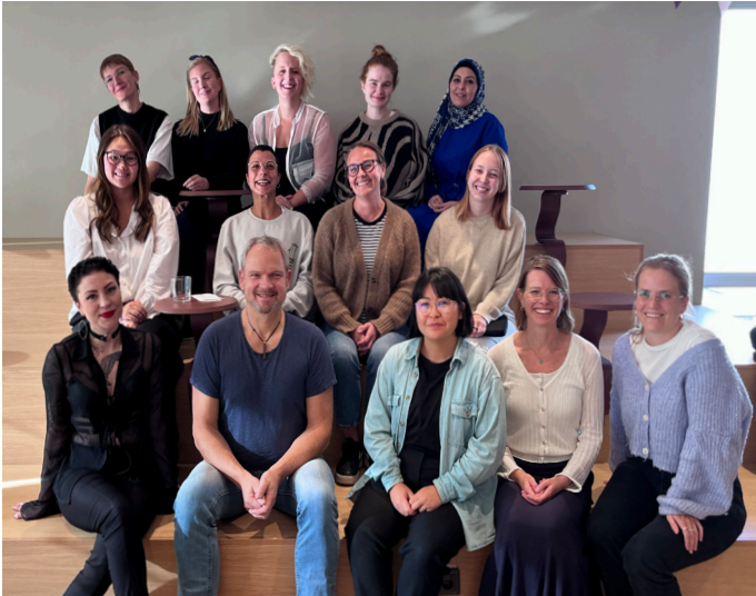
Några av föräldrainsformatörerna i projektet Kan vi prata?

Inom föräldrainsformatörsverksamheten marknadsförs projektet till skolor som RFSU Stockholm har, eller ska, besöka under året och kostnadsfria föreläsningar för föräldrar arrangeras i samarbete med skolan. Utöver föreläsningar så kan informatörerna även leda studiecirklar för föräldrar, där en grupp ses vid tre tillfällen och diskuterar och utbyter erfarenheter kring föräldraskapet, ungas sexualitet och hur man som vuxen kan vara ett stöd för unga i frågor kopplat till kroppen, känslor, identitet, sexualitet och relationer.