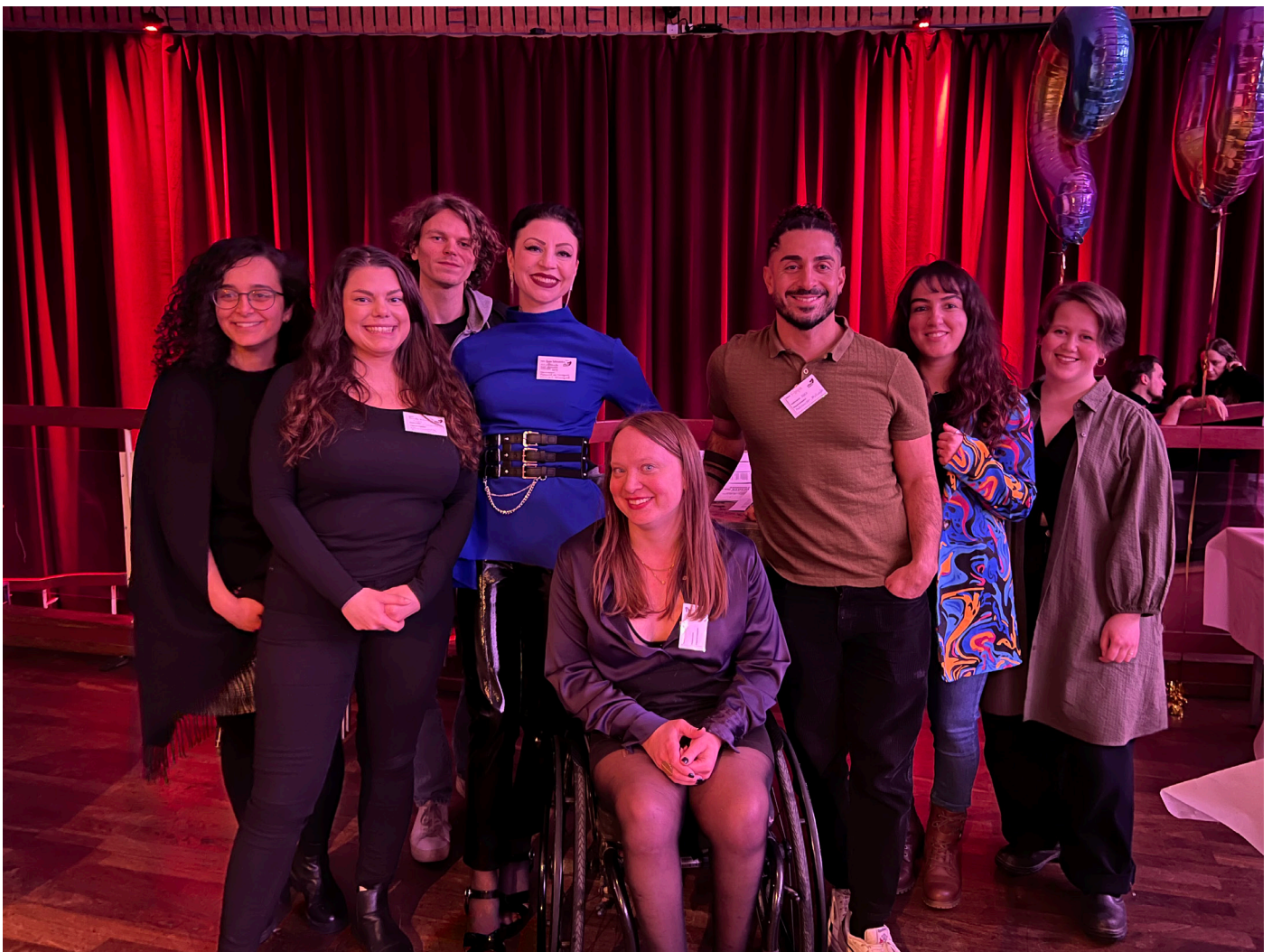
Delar av RFSU Stockholms styrelse 2023 på lokalföreningens årsmöte.