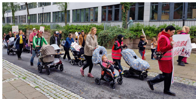
Marschen mot Tantolunden.

En mindre arbetsgrupp bestående av huvudsakligen styrelsemedlemmar från RFSU Stockholm tog sig an uppdraget att planera och genomföra marschen. Styrelsen skrev, som tidigare nämnts, debattartikeln "Ingen ska behöva dö i mödradödlighet" för att väcka engagemang inför Barnvagnsmarschen. Marschen inleddes på Nytorget i Stockholm där ambassadörer från lokalföreningen delade ut regnskydd till barnvagnar, framtagna av konstnären Emilia Ilke, tävlade ut biobiljetter och värvade medlemmar. Innan marschens avgång mot Tantolunden fick publiken lyssna