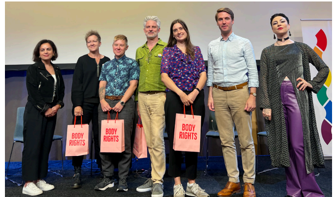
Politikerutfrågning i Pride House.

Under Stockholm Pride följde det politiska utskottet upp den enkät om SRHR i lokalpolitiken som vi skickade ut till lokalpolitiker inför valet 2022 med en politikerutfrågning på Pride House. Representanter från samtliga inbjudna politiska partier deltog och det blev en paneliskussion med fokus på sexualundervisningen i skolan och förlossningsvården i Stockholm.