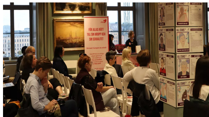
Panelssamtal under jubileumsdagen på Stadsmuseet.