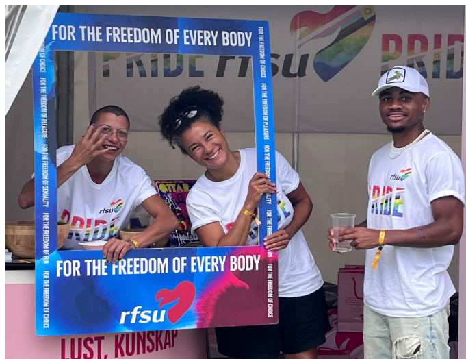
Volontärer i RFSU Stockholms tält, Pride Park.

Stockholm Pride är Nordens största pridefestival och RFSU Stockholm satsade stort på deltagandet 2023. Föreningen var på plats vid flera arenor såsom Pride Park, Pride House, Pride Paraden och Kinkykvarteret. Tack vare en otrolig och gemensam insats av ett 30-tal volontärer bestående av förtroendevalda, medlemmar och kanslipersonal värvades över 200 nya medlemmar. Varav 60 av dessa nya medlemmar till andra lokalföreningar från norr till söder: Umeå, Dalarna, Uppsala, Örebro, Sörmland, Östergötland, Göteborg, Växjö och Malmö.