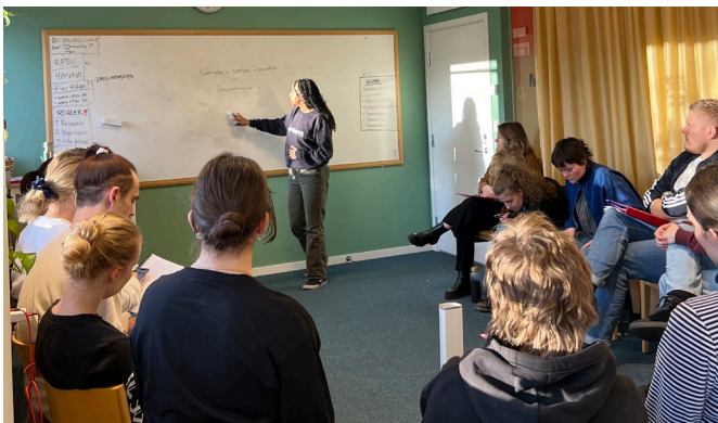
Informatörer under utbildning.

Basverksamheten arbetar med den sexualupplysning som RFSU Stockholm håller för högstadie- och gymnasieelever, ett komplement till skolans egen sexualundervisning. Projektet fortbildar även skolpersonal, ansvarar för att förse verksamheten med informatörer samt utvecklar och kvalitetssäkrar metoder. Vill du? är RFSU:s specifika pass om ömsesidighet och samtycke. Basverksamheten och Vill du? har i stort sett nått samtliga projektmål för 2024 - varav vissa även överskridits. I de enstaka fall målen inte uppnåtts, har det dock inte varit långt därifrån.