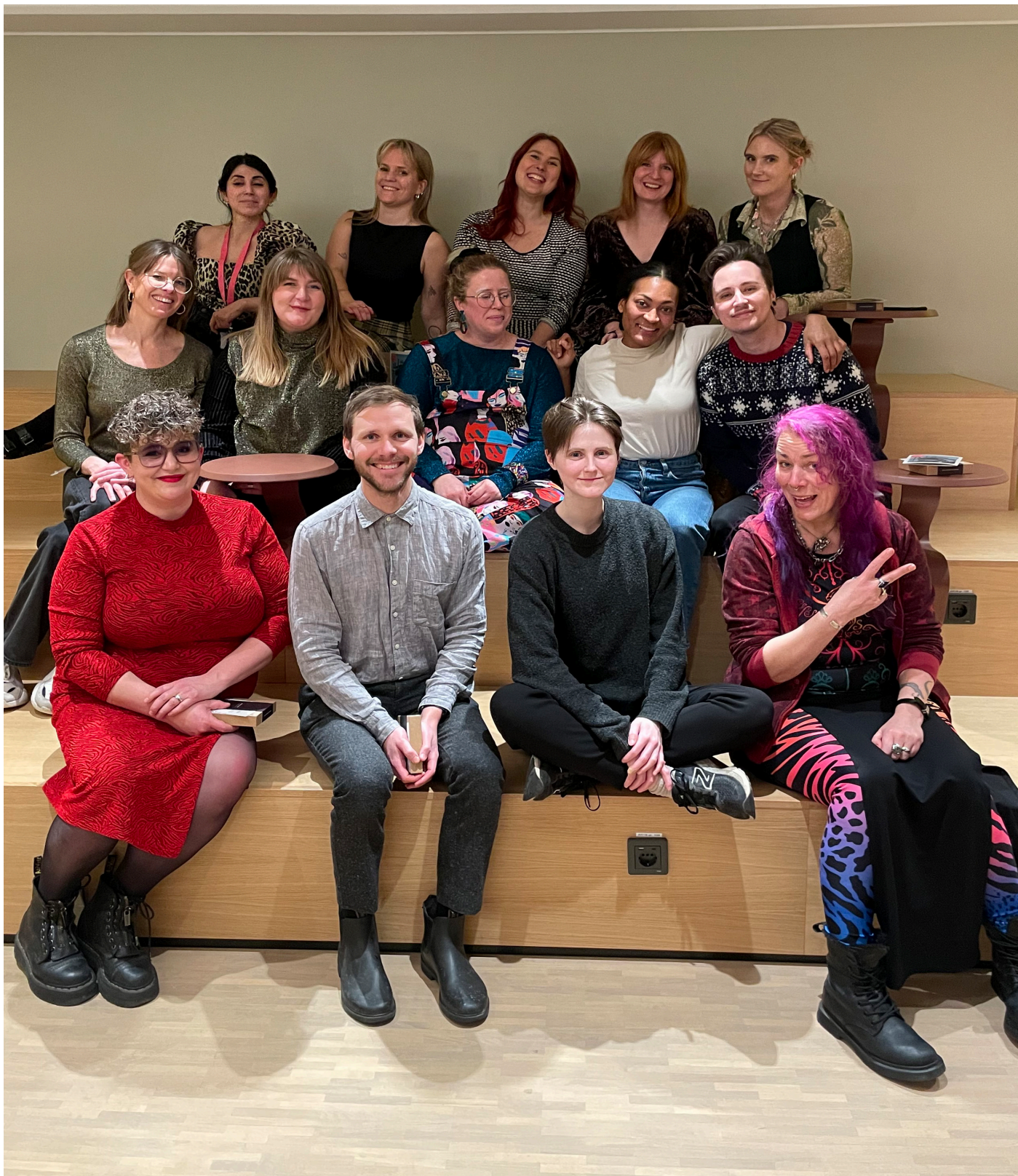
Delar av RFSU Stockholms anställda 2023.