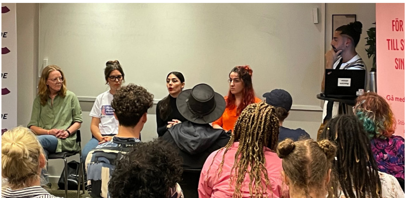
Panelssamtal under Stockholm Pride om hedersrelaterat förtryck och våld, arrangerat av RFSU Stockholm & Origo Resurscentrum.

Under verksamhetsåret har RFSU Stockholm även arrangerat ett välbesökt seminarium på Pride med Origo resurscentrum mot hedersrelaterat förtryck och våld.