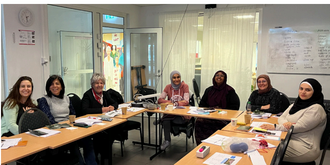
Utbildning av studiecirkelledare, Tonårstid.

Som en del av att nå ut till föräldrar har projektet ett flerårigt samarbete med Studieförbundet i Järva. Samarbetet består av en utbildning för studiecirkelledare inom Studieförbundets föräldraskapsstödjande program Älskade barn om hur föräldrar kan stötta ungas sexualitet och relationer. Efter utbildningen håller ledarna studiecirklar med rubriken Tonårstid. Tonårstid genomförs på svenska och/eller andra språk, under 2023 på somaliska, kurmanji och arabiska.