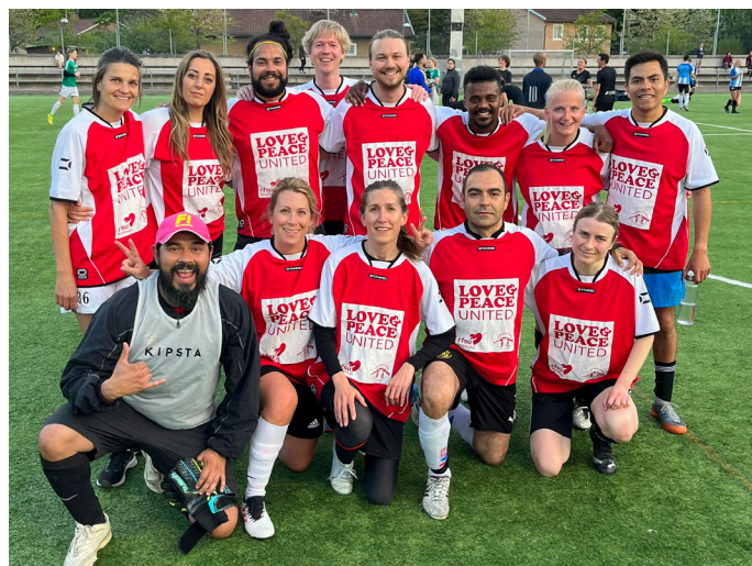
Fotbollslaget Love and Peace United 2023.

Det är viktigt att påminna om att många andra lag består av kollegor från arbetsplatser, studenter från en skola eller program, gamla vänner med mera. Medan Love and Peace United är ett lag som sedan några år tillbaka består mest av många olika personligheter från olika bakgrunder. Det som förenar laget är kärleken till fotbollen och en respekt och uppskattning av det tänk som laget för med sig: att kämpa och vara bra och positiva lagkamrater, motståndare och personer på och utanför plan. Detta är själva grunden för lagets existens som tar det på stort allvar genom att prata om detta i peptalk före varje match och även under och efter matcher vid behov. Ambitionen är att varje spelare ska veta om och ställa upp på dessa värderingar. På det här sättet förs RFSU Stockholm och Svenska Freds värderingar vidare och uppmärksammas på ett väldigt positivt sätt genom att delta och synas inom Korpens verksamheter. Även i år har laget ofta fått höra från motståndare och domare att det är ett duktigt och sympatiskt lag, vilket är oerhört glädjande!