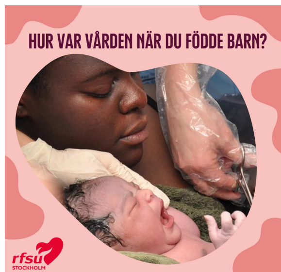
Marknadsföring av enkätstudien i projektet Jämlik förlossning.

I juni beviljades RFSU Stockholm bidrag mot rasism och intolerans för att bedriva projektet Jämlik förlossning av Myndigheten för ungdoms- och civilsamhällsfrågor (MUCF). Projektet handlar om att kartlägga afrosvenska kvinnors erfarenheter av rasism i mödra- och förlossningsvården i Stockholms län. För att bedriva projektet har RFSU Stockholm anlitat konsulter som bedriver intervjuer med kvinnor om deras erfarenheter, projektet har även tagit fram en enkätstudie med hjälp av en analytiker. Enkätstudien går ut på att samla in erfarenheter från kvinnor som har fött barn i Region Stockholm under de senaste 10 åren, därefter kommer datan analyseras för att belysa afrosvenska kvinnors upplevelser. Under våren 2024 kommer projektets två studier sammanställas i en rapport som ska spridas till beslutsfattare samt presenteras under två webbseminarier.