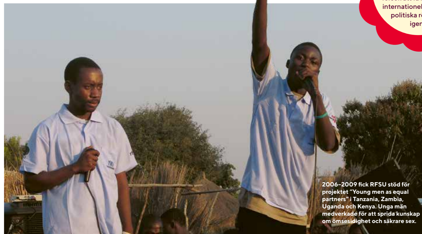
2006–2009 fick RFSU stöd för projektet "Young men as equal partners" i Tanzania, Zambia, Uganda och Kenya. Unga män medverkade för att sprida kunskap om ömsesidighet och säkrare sex.