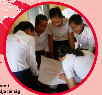
Skolelever i Kambodja lär sig om slidkransen.