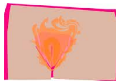
ILLUSTRATION: EVA FALLSTRÖM

Mejla forskarnatverket@rfsu.se eller gå med i facebookgruppen RFSU:s forskarnätverk. Från och med nästa år kommer nätverket ägna tre månader i taget åt ett visst ämne för att riktigt fördjupa sig. Först ut, nu i vinter, är forskning om polyamori. ✿