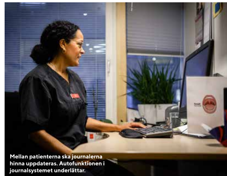
Mellan patienterna ska journalerna hinna uppdateras. Autofunktionen i journalsystemet underlättar.