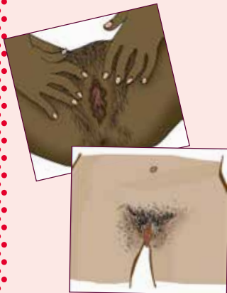
ILLUSTRATION: VENDELA VRENSK

Här har vi valt att använda orden "flickors och kvinnors könsorgan" eftersom det oftast är så dessa kroppsdelar benämns och uppfattas. Tänk dock på att alla som har en snippa inte identifierar sig som flickor/kvinnor och alla som har snopp inte identifierar sig som pojkar/män. Det finns till exempel transkvinnor med snopp och icke-binära personer med snippa.