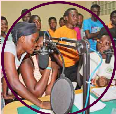
RFSU:s partnerorganisation Curious Minds i Ghana använder sig av radio för att upplysa om abort.

✿ Abort är bara tillåtet då graviditet orsakats av våldtäkt eller incest, när det finns en risk för skador hos fostret eller då kvinnans liv eller hälsa är i fara. Ghana är ett av de länder i världen som har högst antal sökningar efter läkemedlet misoprostol, som används vid medicinsk abort, enligt Google.