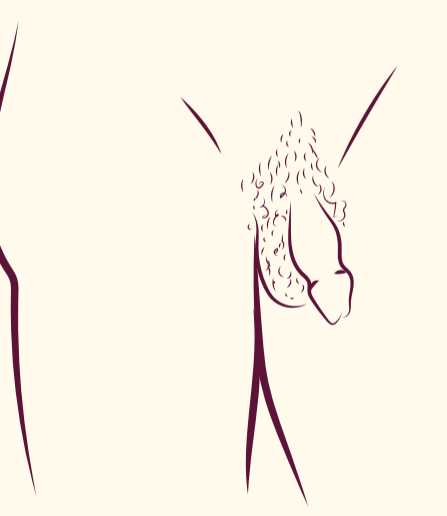
อวัยวะเพศชายและถุงอัณฑะ

เกือบทุกคนมีปัญหาเรื่องการแข็งตัวของอวัยวะเพศชายในบางครั้ง มักเกิดจากการประหม่าหรือเครียด คุณสามารถขอความช่วยเหลือได้ไม่ว่ามันจะขึ้นอยู่กับสาเหตุใดก็ตาม 2 4 17 21