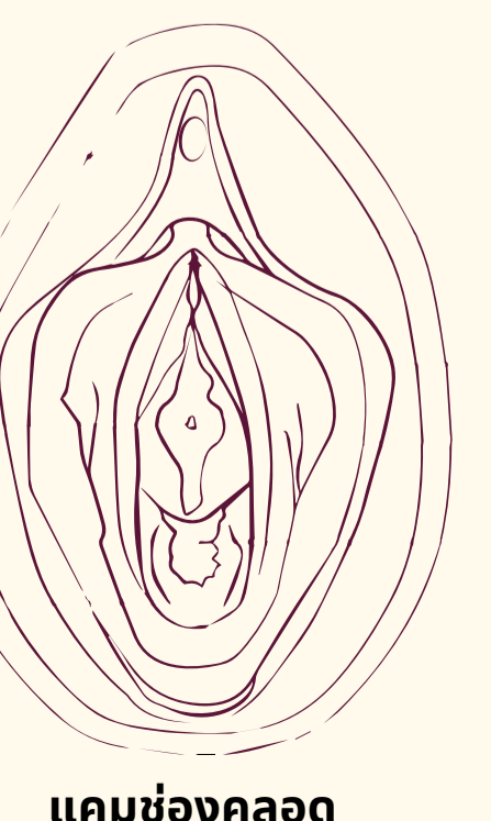
แคมช่องคลอด

มีคนขลิบหรือตัดอวัยวะเพศของคุณหรือไม่ มันขึ้นอยู่กับขั้นตอนที่คุณได้รับที่อาจทำให้คุณมีปัญหาที่แตกต่างออกไป คุณสามารถขอความช่วยเหลือได้ทั้งปัญหาทางร่างกายและจิตใจ 2 4 5 7 13 14