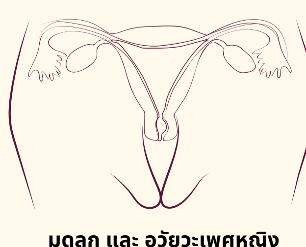
มดลูก และ อวัยวะเพศหญิง

หากคุณมีอาการปวดมาก ระหว่างมีประจำเดือน มีเลือดออกมาก หรือรู้สึกเสิร์้าเมื่อมีประจำเดือน คุณสามารถขอความช่วยเหลือได้ 2 4 5 6 7